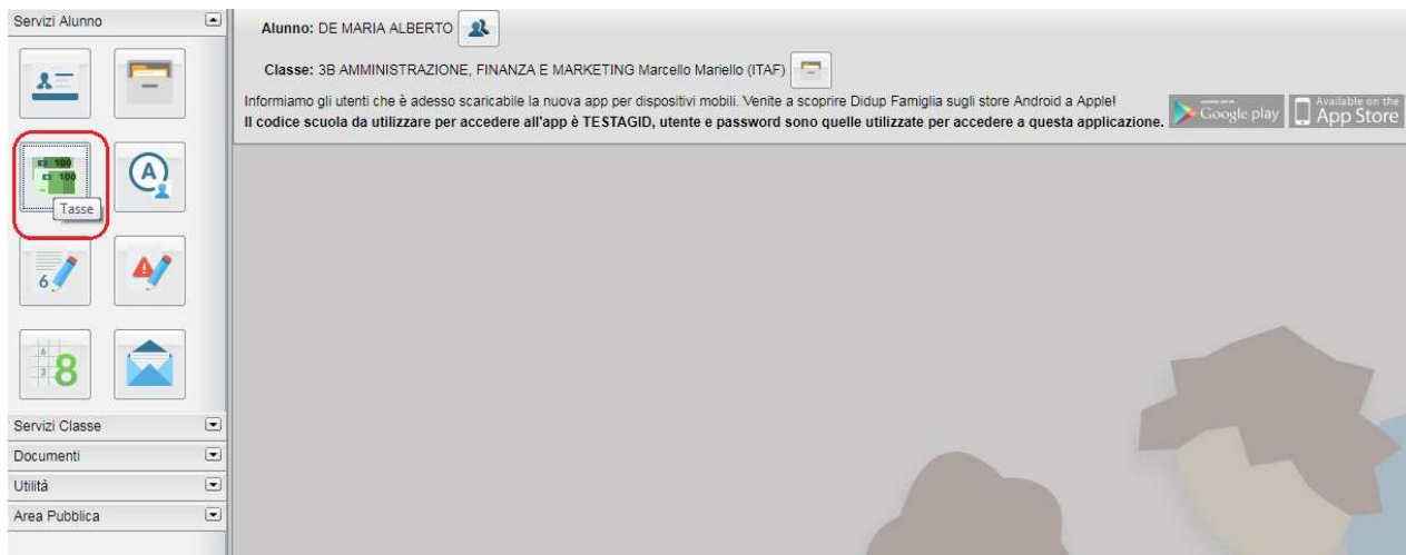
(accesso ai servizi di pagamento)

Il servizio di pagamento delle tasse e dei contributi scolastici è integrato all'interno di Scuolanext - Famiglia, ed è richiamabile tramite il menù dei Servizi dell'Alunno .